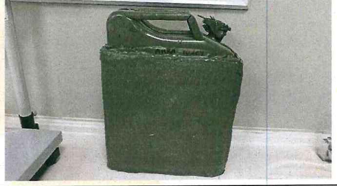
Test Numunesinin Atış Sonrası Arka Yüzey Resmi Rear Surface Image of Test Sample After Shooting