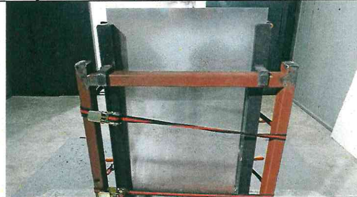
Atış Öncesi Test Numunesinde Kullanılan Tanık Materyalin Resmi Image of Witness Material Used in the Test Sample Before Shooting