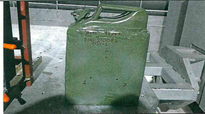
Test Numunesinin Atış Öncesi Ön Yüzey Resmi Front Surface Image of Test Sample Before Shooting