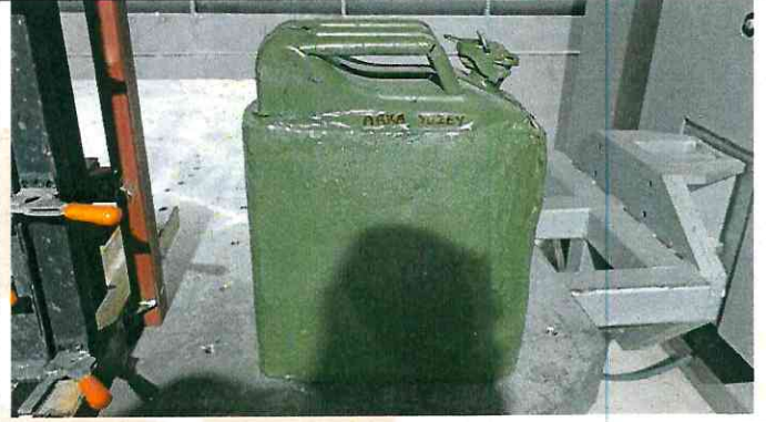
Test Numunesinin Atış Öncesi Arka Yüzey Resmi Back Surface Image of Test Sample Before Shooting